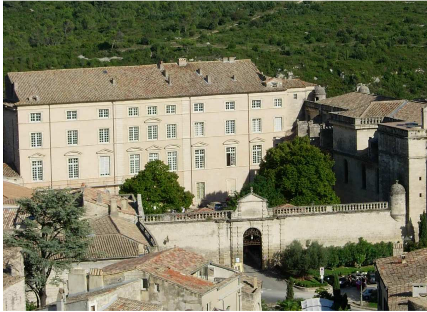
L'ancien évêché d'Uzès (musée Georges Borias au 2 e étage)