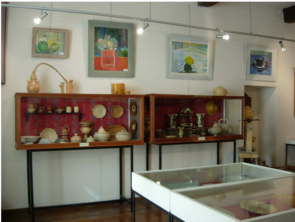
Musée Georges Borias, la salle des poteries